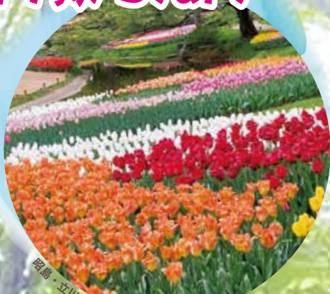
昭島・立川の2市にまたがる国営昭和記念公園