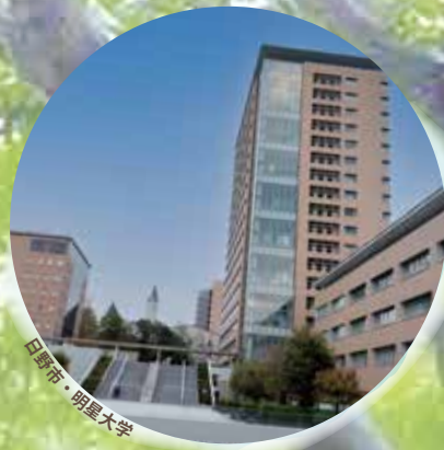
日野市・明星大学