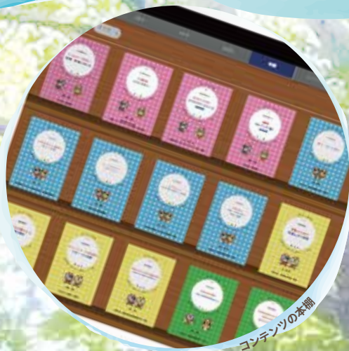
コンテンツの本棚