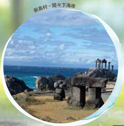
新島村・間々下海岸

東京都でありながら、多摩・島しょでも地方問題が噴出し、若者は都心に集中してしまっています。