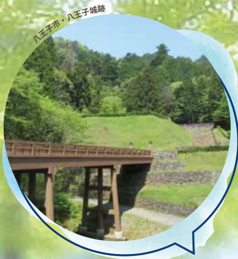
八王子市・八王子城跡