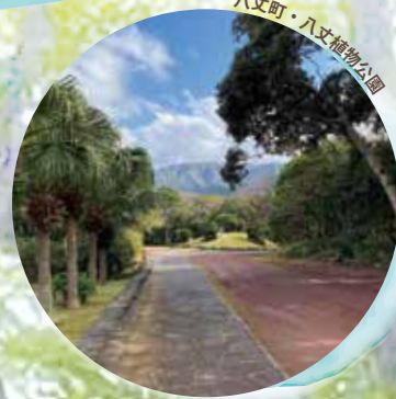
八丈町・八丈植物公園